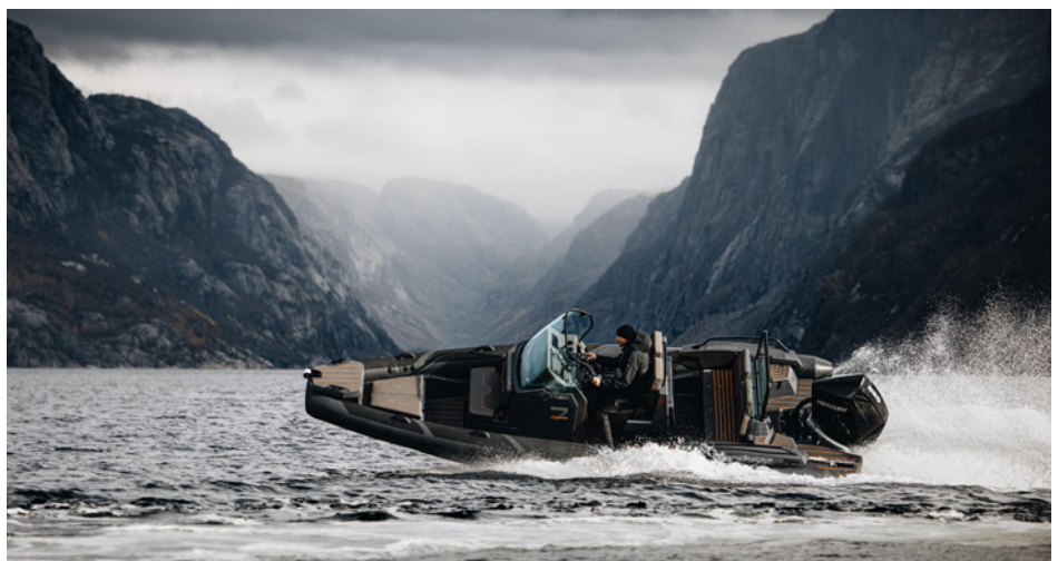
BÅTEN både trives med, og tåler litt sportslig kjøring.