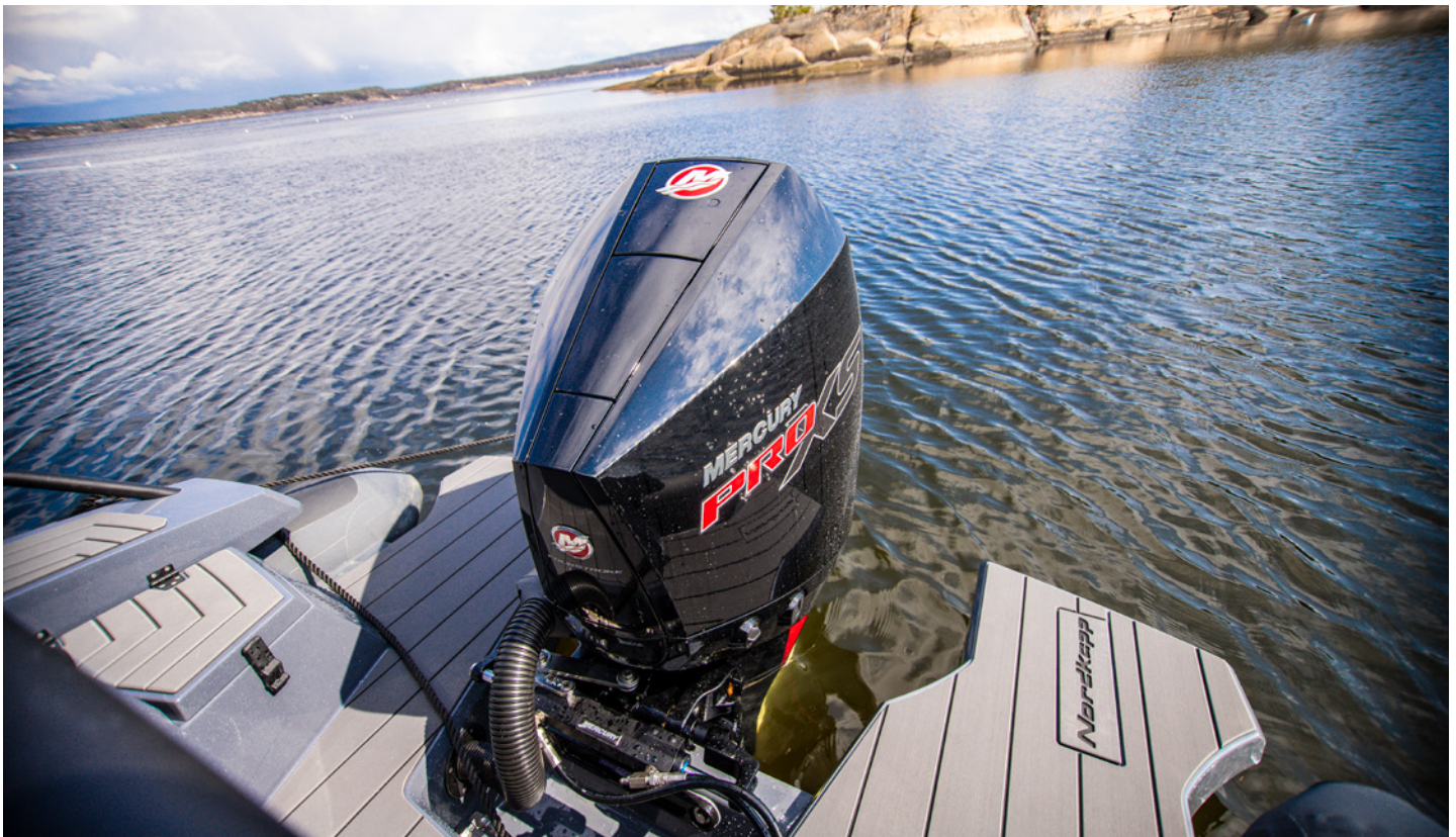
PRAKTISK OG LAV AKTER OG BADEPLATTING , hjelper deg ut i vannet og opp igjen. En glimrende løsning.

håndtak og noe fast å trå på gir jeg igjen et pluss. Badeplattformen er smart bygget rundt motoren på begge sider. Herfra kommer du lett ut i, og opp igjen fra vannet. En skjult badestige under er lett å få tak i, også fra liggende i vannet. Og du kan få dusj montert akter om du vil.